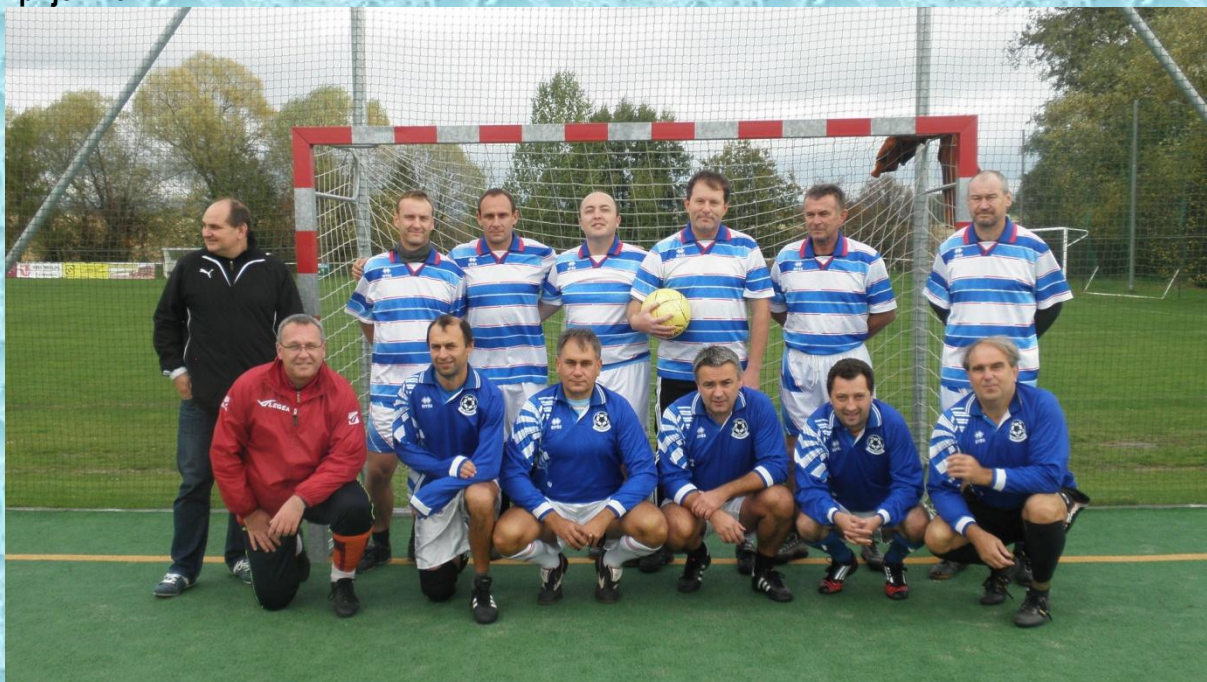
Přátelské utkání společně se slavnostním otevřením venkovního fitness