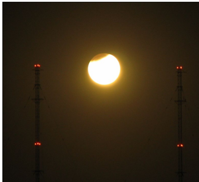
Čahouni na stráží

Pozn.: Lisabonská smlouva (2009) zavedla tzv. řádný legislativní postup v případě nařízení týkajících se politiky hospodářské, sociální a územní soudržnosti EU. Co to znamená? Evropská komise předloží návrhy nařízení Radě EU a Evropskému parlamentu, které o nich spolurozhodují. V obou institucích jsou možné až tři čtení. V případě, že nedojde ke shodě po druhém čtení a legislativa nebyla zamítnuta, dojde mezi Radou EU a Evropským parlamentem k tzv. dohodovacímu postupu. Následuje třetí čtení, v rámci kterého je dokument přijat nebo odmítnut.