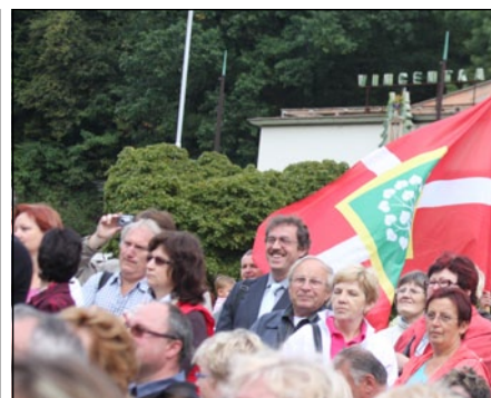
Své obce přijeli povzbudit na slavnostní vyhlášení i obyvatelé

nější. „Rozhodně patřila k mým favoritům. Ta obec žije. Na každém kroku bylo poznat, že tam mezi lidmi panuje sounáležitost. Starají se také o památky a o obecní domy, snaží se všechno udržovat a život u nich je opravdu kvalitní,“ řekl Navrátil.