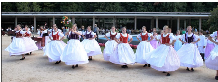
Taneční soubor před lázeňskou kolonádou v Luhačovicích