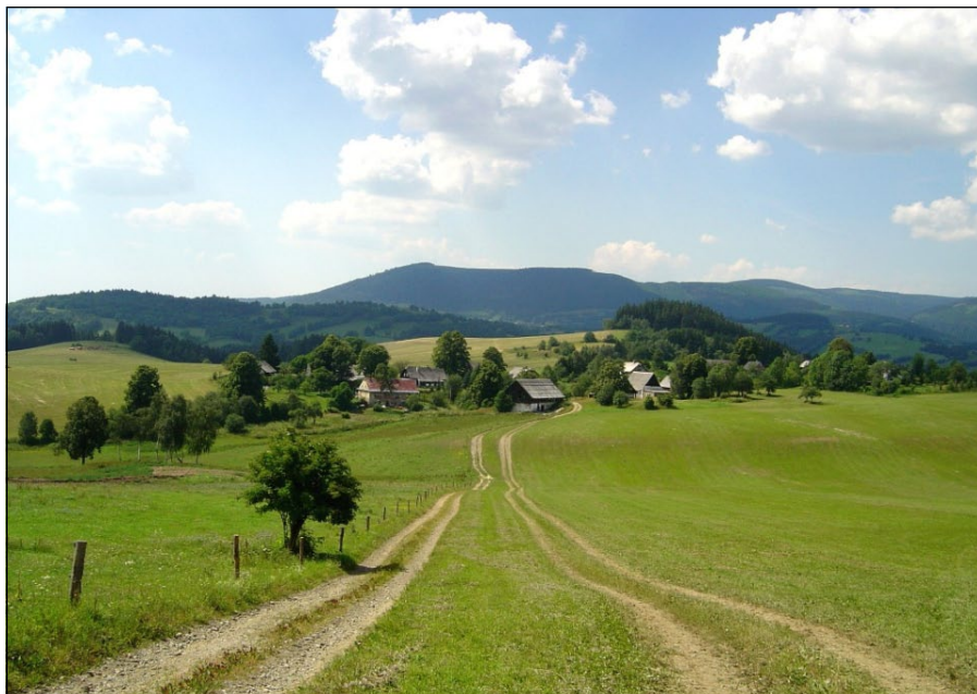
Všechny cesty vedou do MAS

MAS Moravský kras o. s. a Výzkumný ústav Silva Taroucy pro krajinu a okrasné zahradnictví vyhlásily 14. září 2012 výzvu k předkládání projektů v rámci výzkumného projektu NAZV „Lokální identita zeleně venkovských sídel“. „Chceme podpořit kvalitní výsadbu zeleně ve veřejně přístupných plochách v intravilánech menších vesnických sídel na území mikroregionů Moravský kras a Časnyň. K výsadbám je nutné využít tradiční dřeviny, staré odrůdy, typické trvalky a letničky, genové rezervy apod.“, uvádí autoři výzvy. Na projekty je k dispozici 100 tisíc korun. Jejich příjem bude probíhat od 1. do 5. října. Žadatelé mají možnost získat minimálně pět a maximálně dvacet tisíc korun. Zdroj: MAS MK