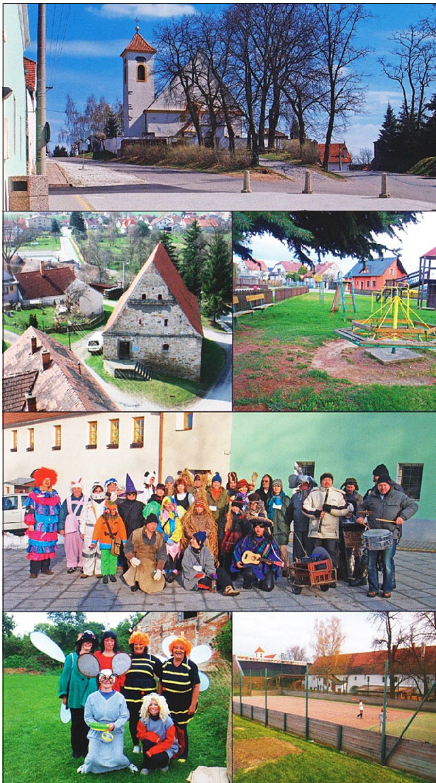
Mezi významné památky v obci patří kostel, bašty, obytné stavení č. 1 včetně dvora štítu na bývalé ratejně, kapličky, špejchar či kamenný můstek mezi rybníky.