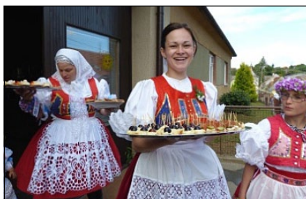
Hody v obci Rudka

„Ministerstvo zemědělství je jedním z vyhlásovatelů soutěže Vesnice roku, v rámci které udělujeme ocenění Oranžová stuha za vytváření podmínek pro plnohodnotný život