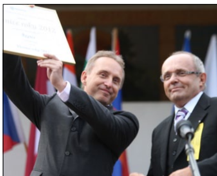
Starosta Řepice se raduje z ocenění, kterou předal ministr Kamil Jankovský