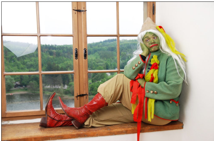
Kategorie LIDÉ: 1. místo – Vypuštěná přehrada aneb konec vodníka na Plumlově?