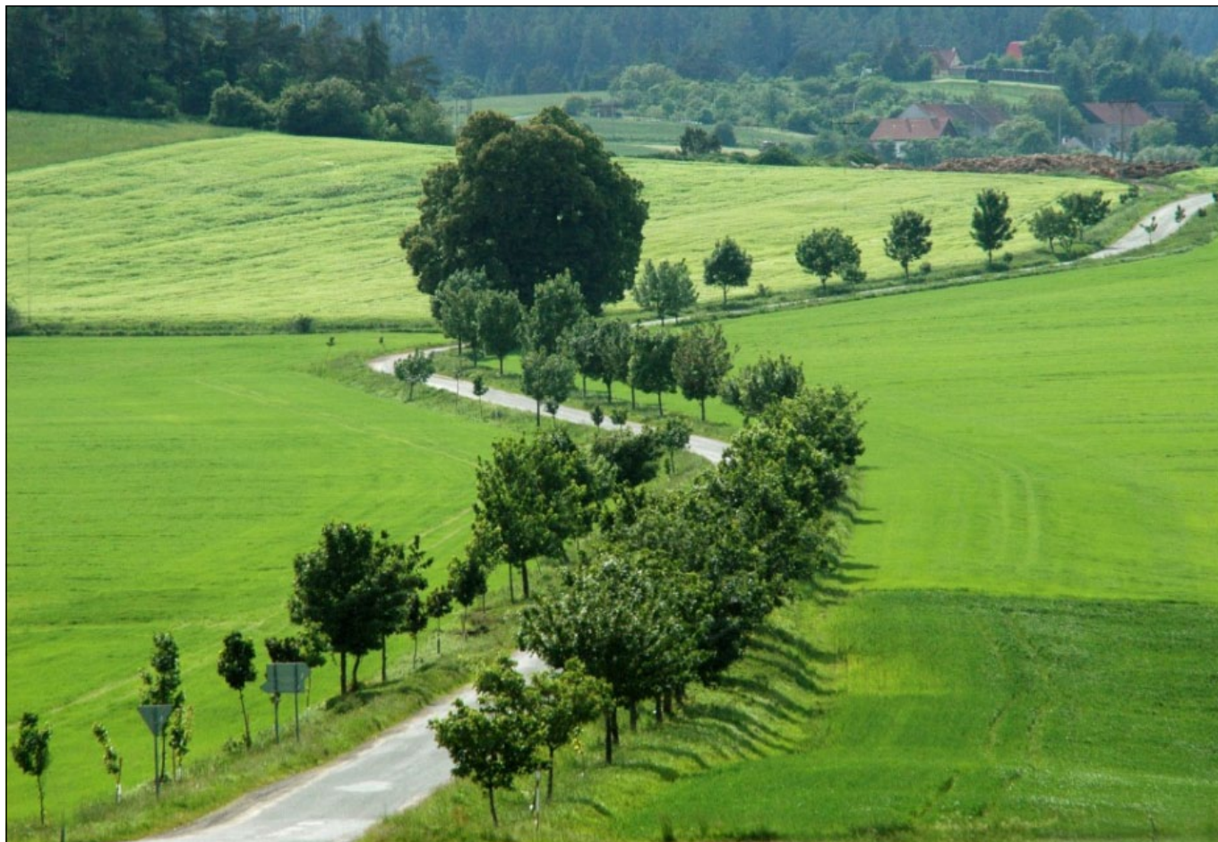
Ve fotografické soutěži NS MAS zvítězil v kategorii „Příroda“ snímek Malebná krajina Prostějovska od Boba Pacholíka z regionu MAS Prostějov venkov