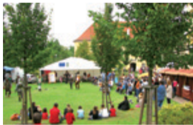
Hanácké farmářské trhy v Litovli, 10. 9. 2011

Obyvatelé města Litovel navštívili přehlídku domácích výrobků celkem třikrát. Akce se uskutečnila na náměstí v Litovli. Farmářský trh pravidelně nabízel od 14 do 18 hodin nejméně 30 prodejců nejrůznějších kvalitních potravin, jako jsou domácí sýry, maslo, maso, uzeniny, ryby, pečivo, zeleninu, burčák a spoustu dalších dobrot. Nechyběl ani doplňkový sortiment od koření až po přírodní kosmetiku.