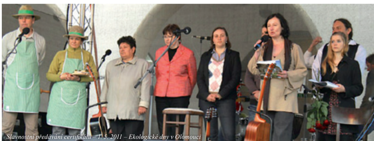
Slavnostní předávání certifikátů – 1. 5. 2011 – Ekologické dny v Olomouci