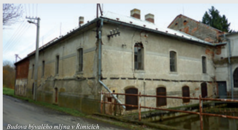
Budova bývalého mlýna v Řimicích

V případě, že by mladečský mlynář jako nejbližší k jezu seznal za nutnou nějakou opravu, měl poslat prvnímu sousedovi dřevěnou sekýrku, ten ji měl do hodiny předat dalšímu a ten opět dalšímu tak, aby ještě v průběhu téhož dne dorazila až k mlynáři ve Lhotě. Ten musel následujícího dne časně