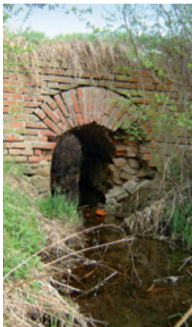
Sto let podpirám cestu. Kdo podepře mne.