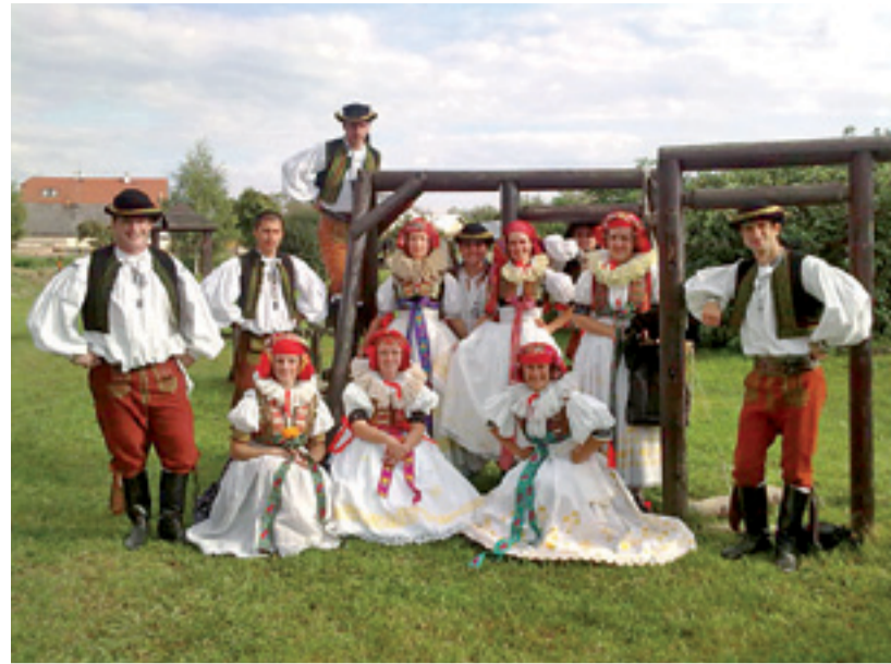
Národopisný soubor Cholinka, DEN MAS v Sobáčově

MAS Moravská cesta má na starosti 21 obcí (od Křelova po Bouzov) a v současné době působí jako rozvojová agentura, která vybírá místní projekty ze svého regionu v programu LEADER. V letech 2008–2011 podpořila 60 projektů místních žadatelů za 40 milionů korun.