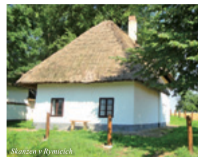
Skanzen v Rymicích

Občanské sdružení získává dotace i z jiných programů: SROP, ROP, INTERREG a dalších.