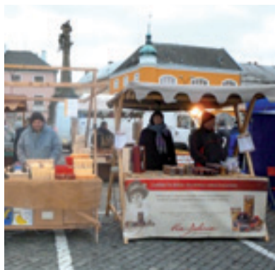
Hanácké farmářské trhy v Litovli, 16. 12. 2011

Hanácké farmářské trhy v Litovli pořádá: MAS Moravská cesta, město Litovel, Městský klub Litovel a Mikroregion Litovelsko.