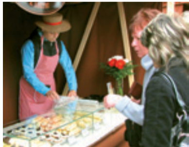
Hanácké farmářské trhy v Litovli, 7. 10. 2011

Těžištěm akce, která představila i držitele regionálních značek „HANÁ regionální produkt“ a „JESENÍKY originální produkt“, byl řemeslný jarmark. Trhy na náměstí byly doplněny o jedinečné vystoupení kapel Medicimbal a Na Vostro, které svým širokým repertoárem uspokojily posluchače každé věkové skupiny.